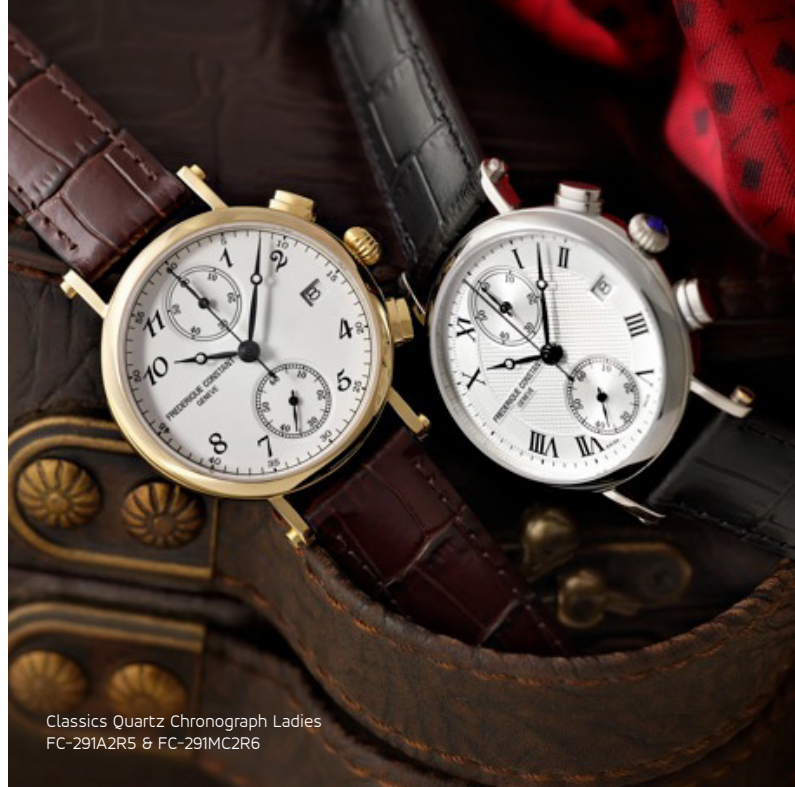
Classics Quartz Chronograph Ladies FC-291A2R5 & FC-291MC2R6