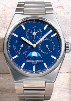
Highlife Perpetual Calendar Manufacture FC-775N4NH6B